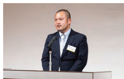
伏見クリエイト株式会社