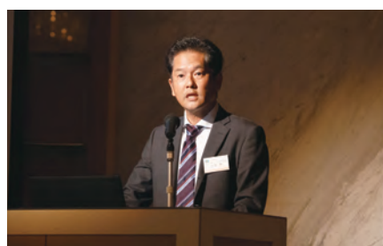
有限会社トラックアズマ