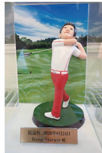
還暦記念フィギュア